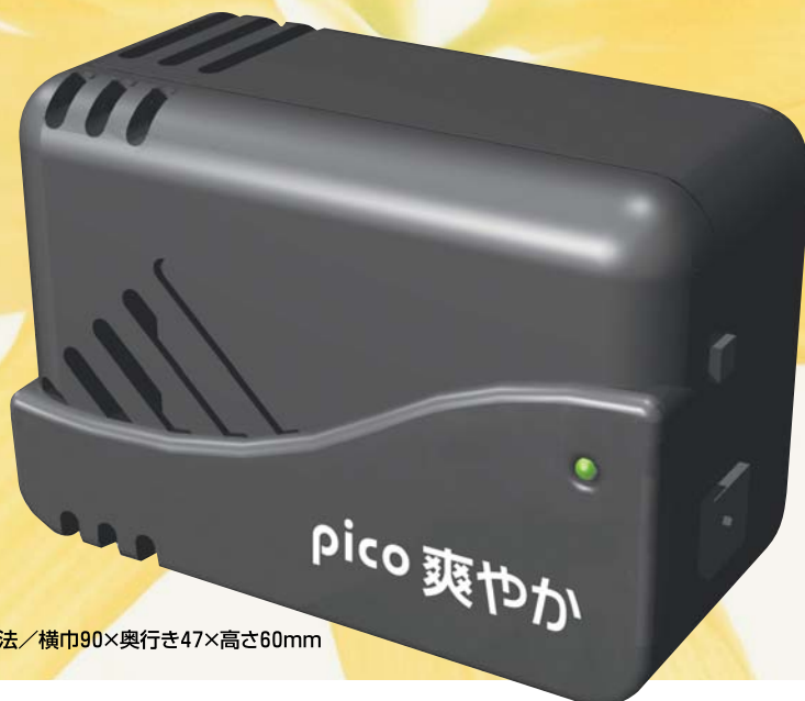
本体寸法／横巾90×奥行き47×高さ60mm